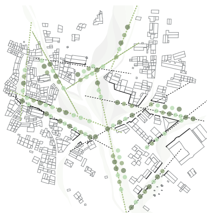
> PROLONGER LES TRAMES EXISTANTES