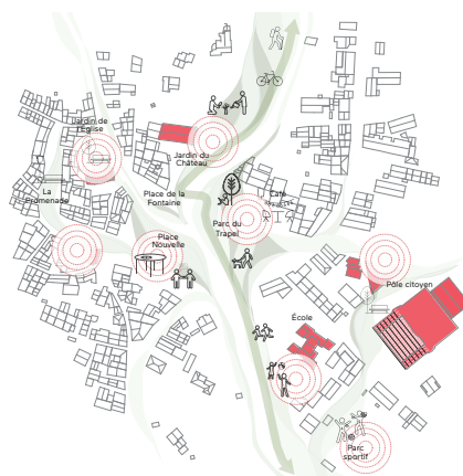
> RÉ INVESTIR L'ESPACE PUBLIC