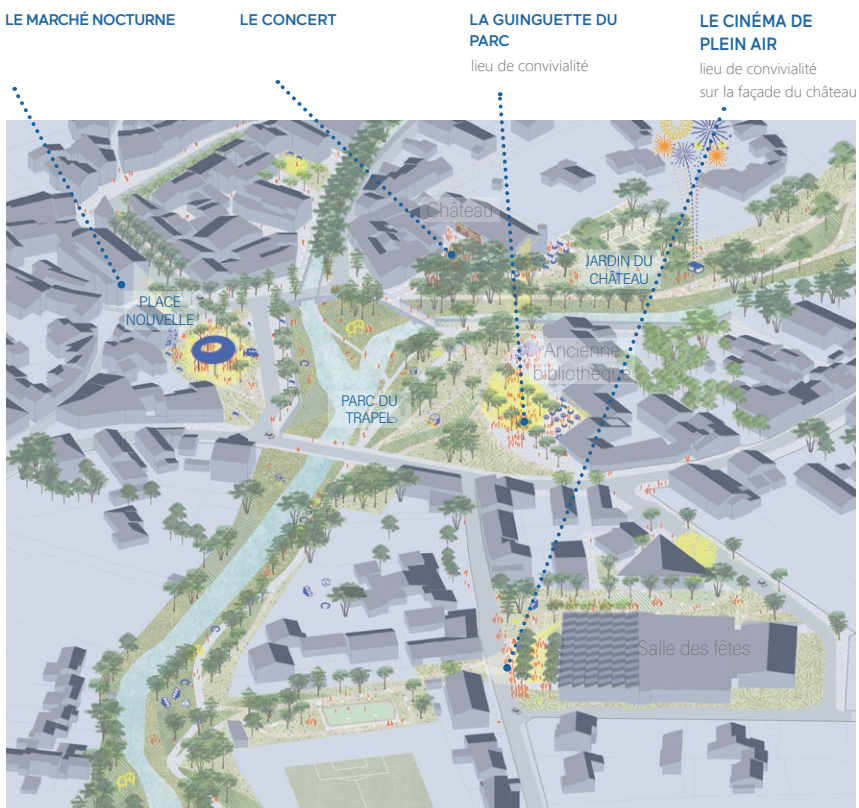
> VILLEGAILHENC, UNE ANIMATION NOCTURNE DE L'ESPACE PUBLIC

De plus, pour répondre aux besoins des habitants mais aussi des visiteurs, la requalification urbaine doit être composée d'espaces publics qualitatifs et modulaires, mais aussi d'aménités appropriables. Ces espaces devront faire preuve d'évolutivité : en fonction des heures de la journée, des usages et des saisons. Cette mutualisation des espaces au cours de diverses temporalités infère un aspect unique et vertueux au projet. Par exemple le site pourrait accueillir une programmation de manière diurne et des programmes de loisirs/ sport et animation en fin de journée et/ou le soir.