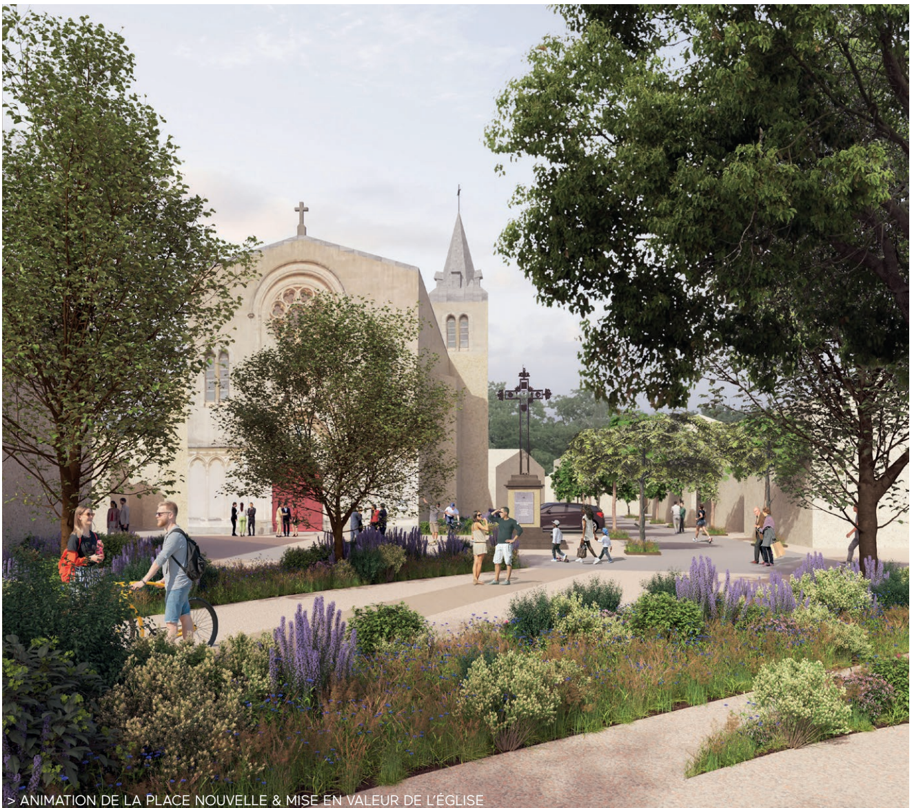
> ANIMATION DE LA PLACE NOUVELLE & MISE EN VALEUR DE L'ÉGLISE