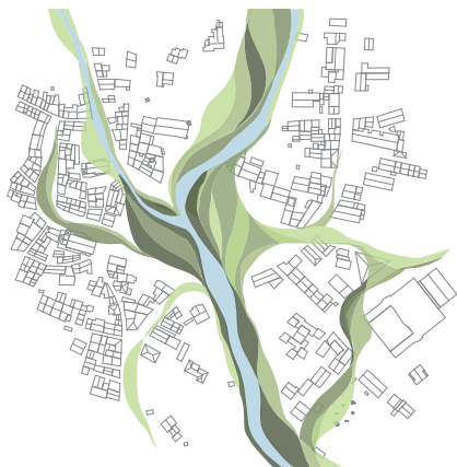
> LES GRANDES CONNEXIONS PAYSAGÈRES