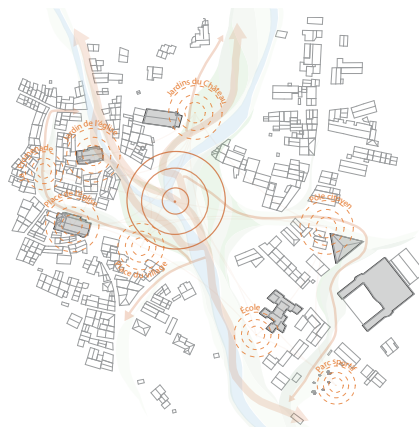
> CENTRALITÉ & MISE EN RÉSEAU