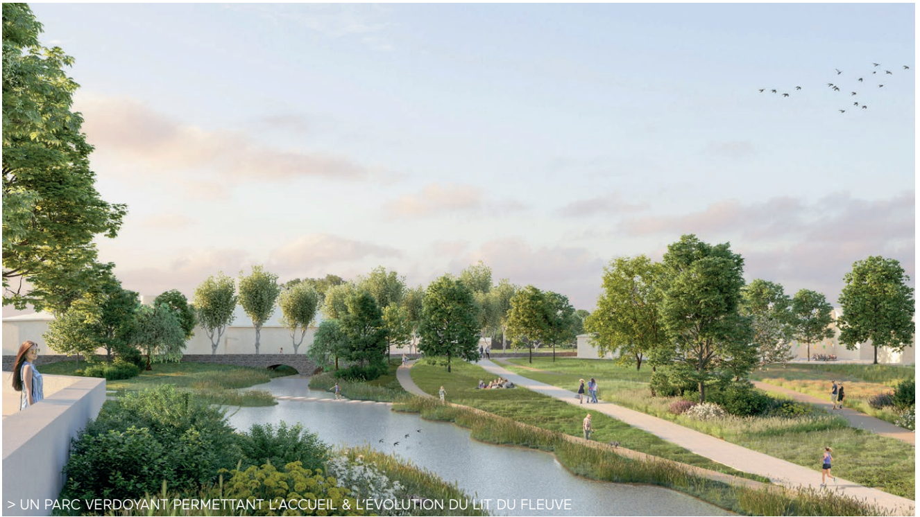
> UN PARC VERDOYANT PERMETTANT L'ACCUEIL & L'ÉVOLUTION DU LIT DU FLEUVE